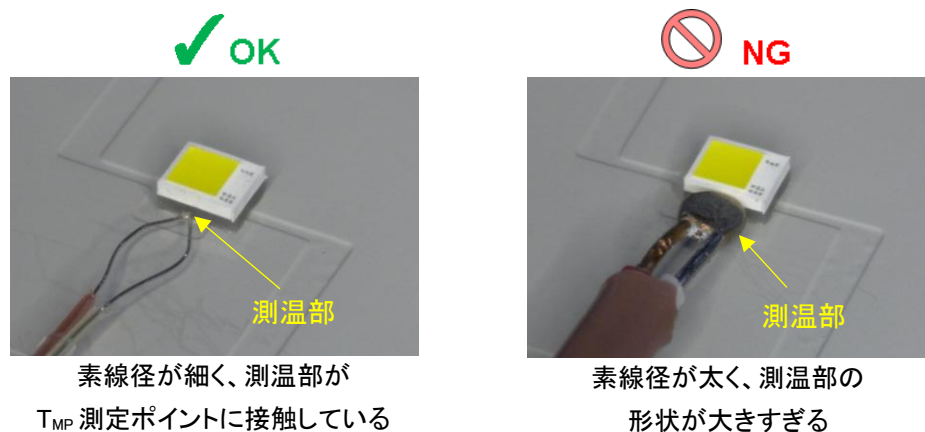
図 2. 熱電対取り付けの例(接着剤塗布前)

熱電対は、できるだけ素線径の細いものをご使用ください。素線径が太い場合、放熱経路となり測定値に誤差が生じる可能性があります。また、図 2 に示すように、熱電対の測温部が大きくなると、測定したい部分へ接触できないことがあります。測温部が LED のセラミックス基板から離れたり、セラミックス基板以外の部分に接触したりすると、測定値がばらつく原因となりますのでご注意ください。