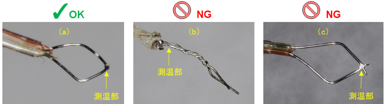
図 3. 熱電対の測温位置

熱電対の測温位置は、接合もしくは接触の根元部分です。図 3(b)のように根元でねじれた熱電対では、先端部分ではなく、ねじれの部分で測温します。熱電対先端が T_{MP} 測定ポイントに接触していても、測温部が離れてしまうと T_{MP} が低くなる可能性があります。測温部が T_{MP} 測定ポイントに接触するようご注意ください。